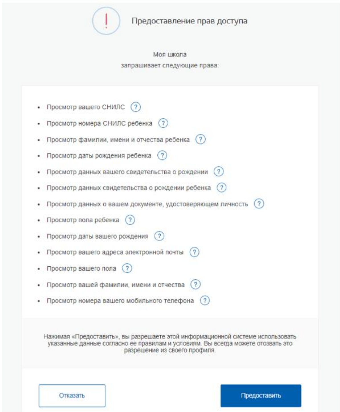
Рисунок 3. Предоставление прав доступа

Нажимая кнопку «Предоставить» , вы разрешаете ФГИС «Моя школа» использовать указанные данные для авторизации в системе.